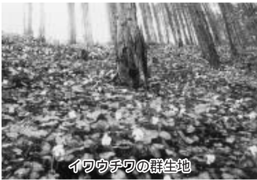
イワウチワの群生地

（農林振興課長） 県民税の活用については、奥山林あるいは里山林の整備や森をはくくむ人づくりの支援で、町は里山林の整備を担当することとなる。自然景観を将来まで守り残したい里山や、通学の安全を確保するための里山などの森林整備が中心で、ボランティア活動支援、公共施設等木質化の推進など、今後、整備計画を策定して活用したい。当町における森林施策については、間伐等の推進により森林の適正管理に努めると