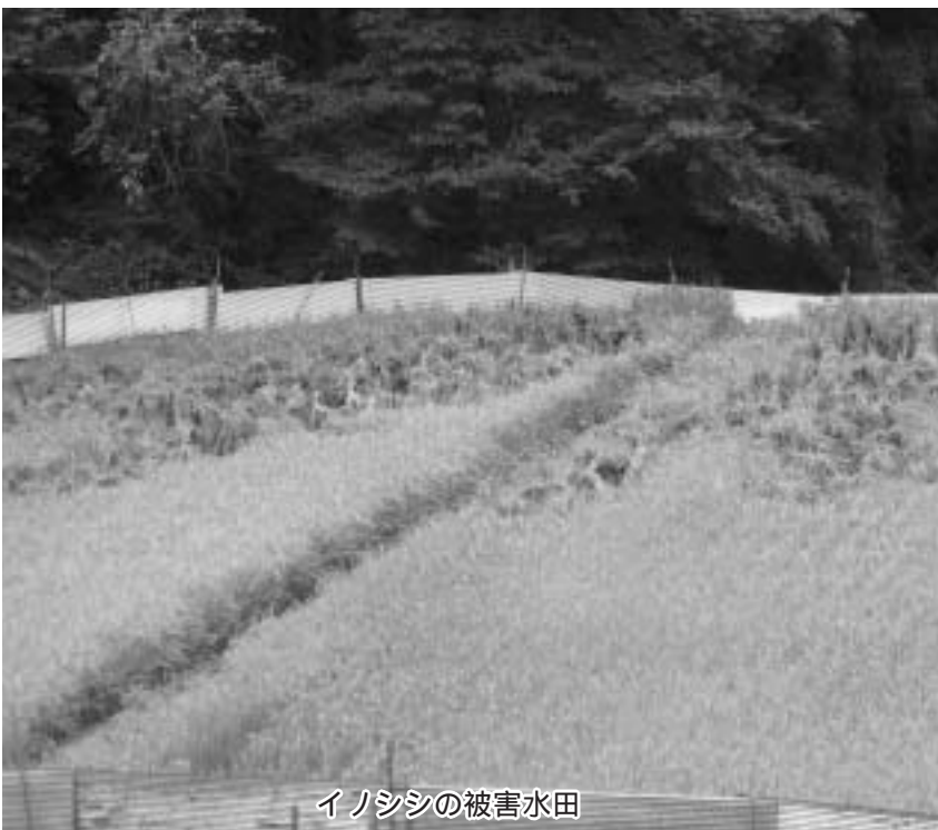
イノシシの被害水田

⑤捕獲したイノシシは買い上げる考えで進めているが、平成20年度にイノシシ処理施設の設定を計画しており、現在、その管理運営計画を策定中であり、その中で検討したい。