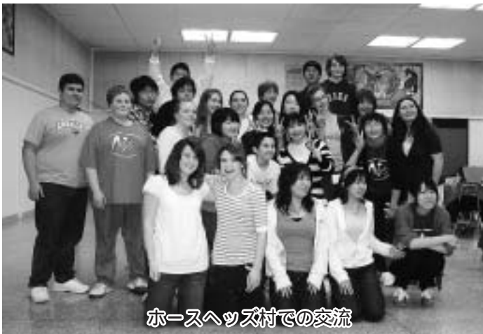
ホースヘッズ村での交流

③那珂川町は、交流事業を町が行っているが、ホースヘッズ村ではボランティアによって行われている。合併して昨年は14名を派遣したが、ホストファミリーを見つけないで大変苦労したと聞いたので、今回は12名の派遣としたが、議員指摘の点について、今回の訪問時に増員が図れるかどうか話し合ってきたい。