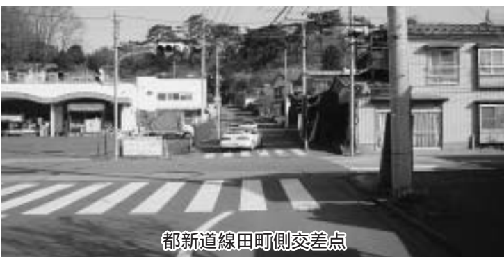
都新道線田町側交差点

を図る必要があることから、平成18年度に整備に向けて調査費を計上し、地元地権者と関係者に対して説明会を開催した。その後、用地調査を行ったところ、公図と現況に大幅な違いがあり、用地の確保が非常に困難であることが判り、現在、公図の確定を行うために地籍調査を実施している。地籍調査は平成20年度に完了する予定となっている。 ②交通の規制は交通管理者である警察署の所管であるが、周辺住民の意向を調査した上で要望等を検討したい。