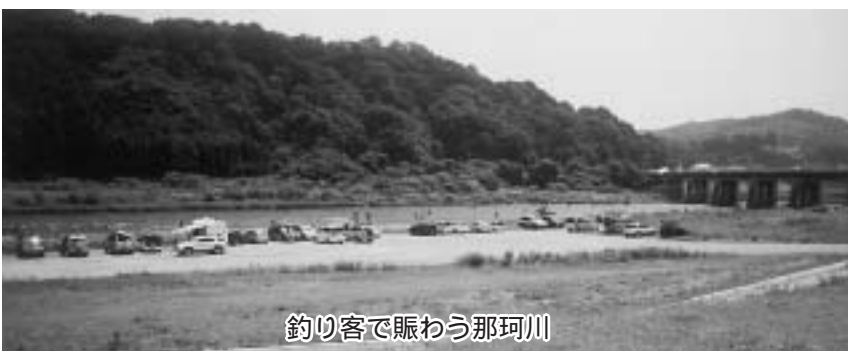
釣り客で賑わう那珂川

既に議会には漁協から反対の請願が提出されており、また、今後、国から町に対しての説明があるとのことであることから、これらの意見等も十分に拝聴して、町としての考え方を述べていきたい。反対するのが良いのか現時点では何とも言えない状況であるが、那珂川の生態系を守っていくというのが町としての大きな基本的なスタンスである。