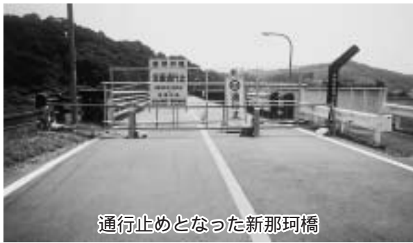
通行止めとなった新那珂橋

③平成20年度の県との事業打合せの中で、早急に結論を出してもらうように要請をした。