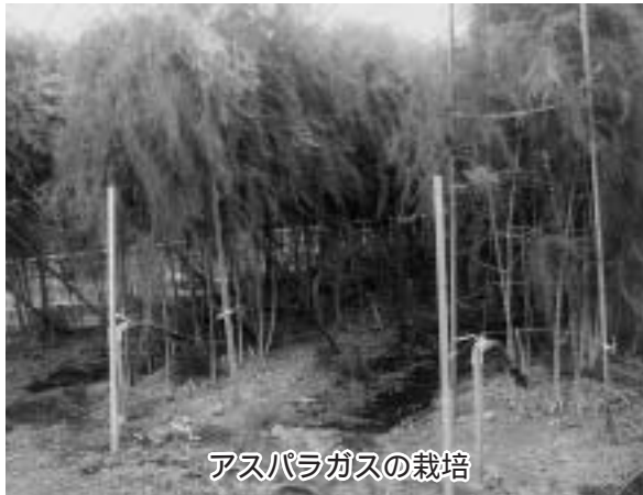
アスパラガスの栽培

（農林振興課長） ②平成20年度農村漁村活性化プロジェクト支援交付事業により総事業