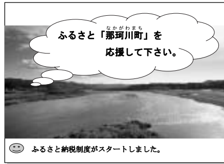
ふるさと納税パンフレットより

④寄付者への返礼品については、庁内検討会で協議し、県内者に対しては、広重美術館・ゆりがねの湯・まほろばの湯の招待券のセット。県外者に対しては、町特産品のPRを目的に、物産振興会のふるさと便、広報「なかかわ」を送付する事としている。