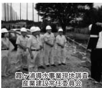
霞ヶ浦導水事業現地調査 産業建設常任委員会

過疎地域自立促進特別措置法が平成22年3月に失効することから、全国過疎地域自立促進連盟の依頼を受けて総務企画常任委員会において審査を行い、「新たな過疎対策法の制定に關する意見書」を國の關係機關に提出することを決定しました。 (全員賛成 原案可決)