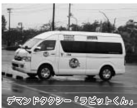
デマンドタクシー「ラビットくん」

当議会においても特別委員会で地域振興に取り上げる一つの課題として議論を重ね、町の振興・活性化に反映できることを期待し、行政調査の報告とします。