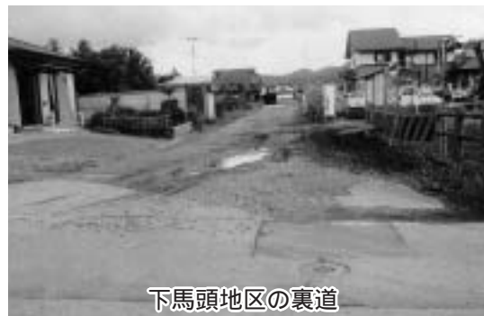
下馬頭地区の裏道

（建設課長） ③当地区内には5路線の町道があり、うち3路線が砂利道となっている。近年、住宅も増えてきていることから、今後、住宅の建設状況を見極めながら町道の舗装整備を検討していく。