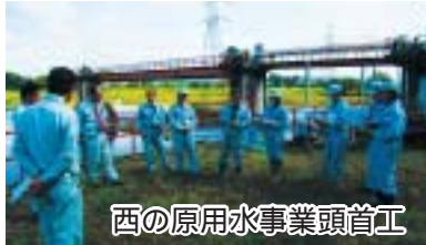
西の原用水事業頭首工

また、10月9日に国営の総合農地開発事業（昭和49年着工）として開拓された3市1町（那珂川町、大田原市、さくら市、那須烏山市）に及ぶ塩那台地の造成地と取水取水口並びに大田原市から那須烏山市までの農業利水を行っている西の原用水事業頭首工の現地視察を行いました。