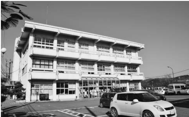
10月10日から「小川出張所」となった小川庁舎