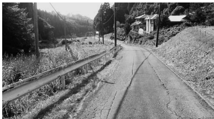
県道大山田下郷小砂線の小砂仲郷上地区

質問 県道整備はいつになるかわからないとの声もあり、町道にして整備した方が早いのではないのか。