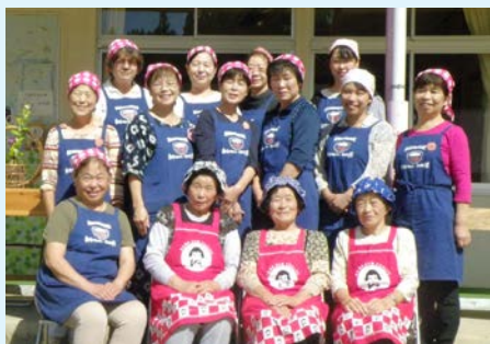
みんないつも笑顔

A H26年に小砂が美しい村 連合に加盟して、地域に休 憩する場所がないことから お母ちゃん達が集まって始 めたのよ。