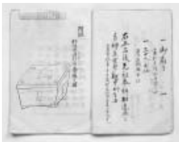
野州恩田社前香爐（炉）之図 個人