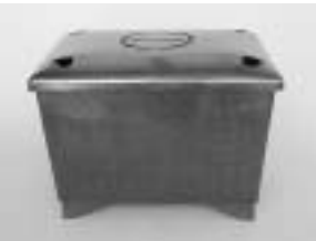
銅製香炉 御霊神社