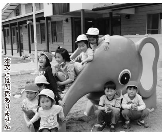
本文とは関係ありません