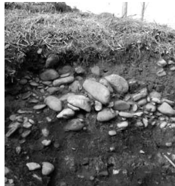
新たに前方部で発見された石室

那須地域では、西暦600年代後半に那須を統治した那須直草提の名が国宝那須国造碑（湯津上）に見え、浄法寺廢寺（小川）、尾の草遺跡（馬頭）といった関東最古の寺院と共に、新羅国（朝鮮半島にあった国）などの渡来人の影響を強く認められます。このような特殊な歴史と文化を背景に