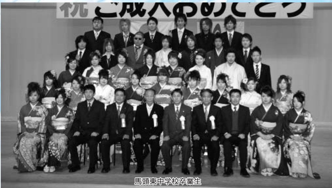
馬頭東中学校卒業生