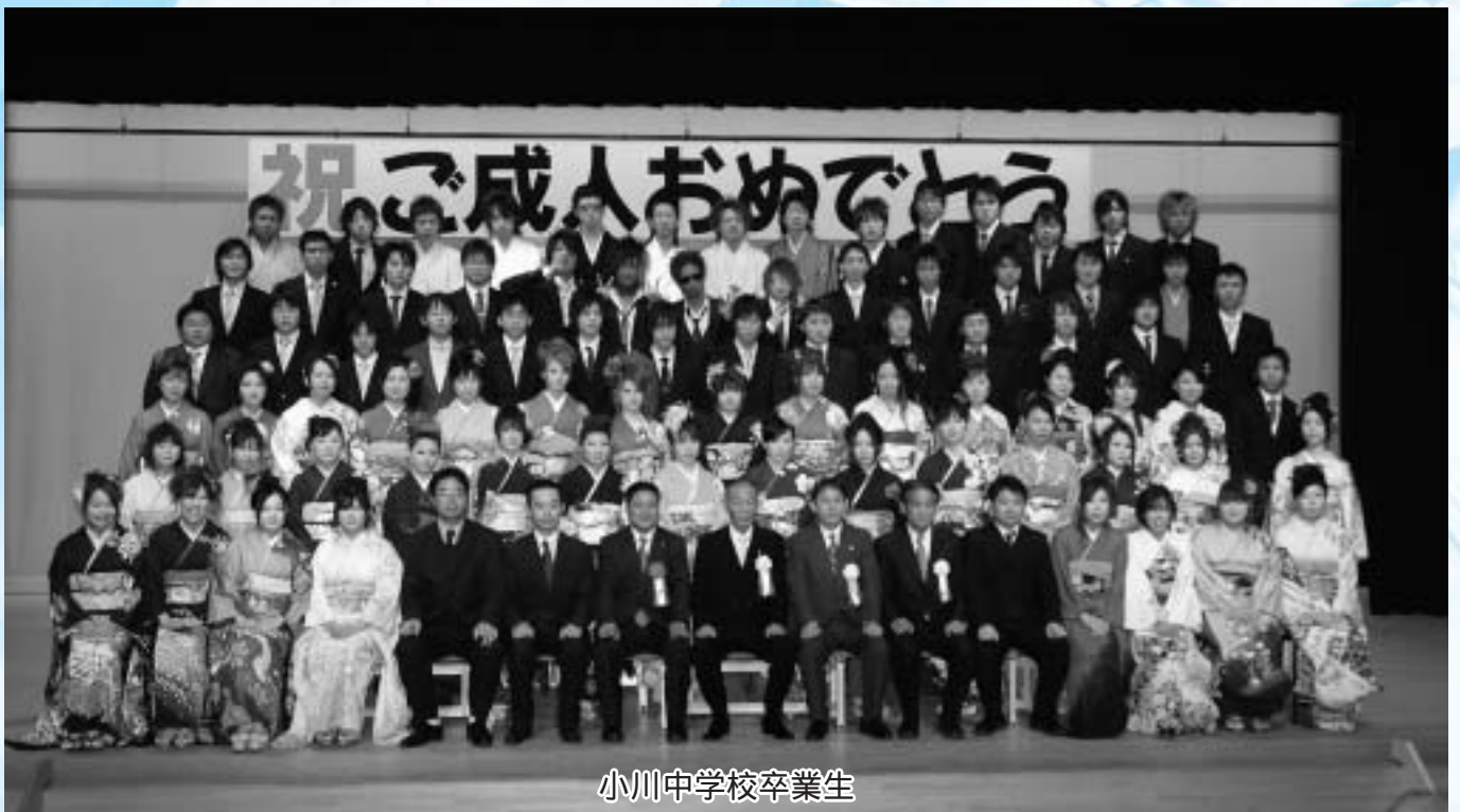
小川中学校卒業生