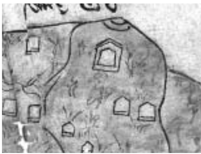
「和見古地図」に描かれた唐御所

中でも、唯一国史跡に指定されている「唐御所」は、古くから有名な存在でした。栃木県の横穴墓に関する史料は、最も古いもので江戸時代にさかのぼるものがあり、当時の史料には「唐御所」が必ず登場します。