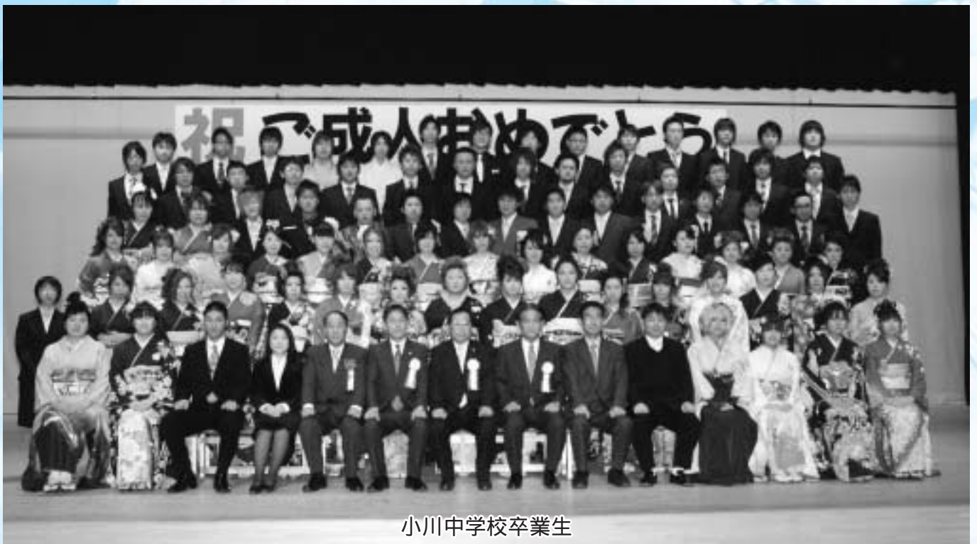
小川中学校卒業生