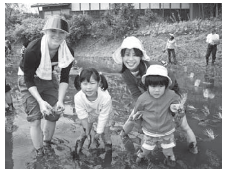
みんなで仲良く田植えしました