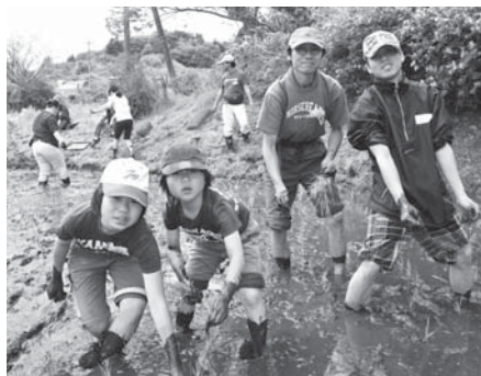
上手に植えられたかな？