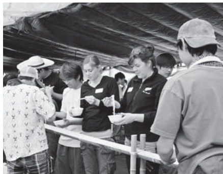
流しそうめんを初体験