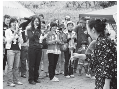
けん玉の技に興味津々