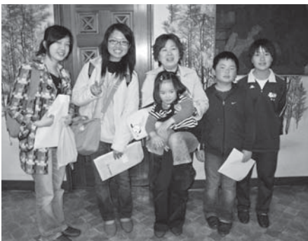
ホームステイ先家族と対面

国際交流事業は、時代の流れとともに変化しています。しかし、日本の家族の大切さは留学生に教わっている気がします。