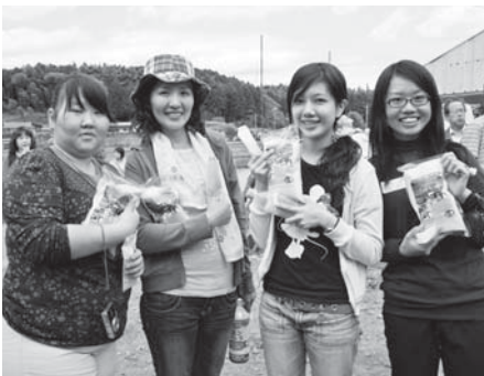
去年収穫したお米をもらいました