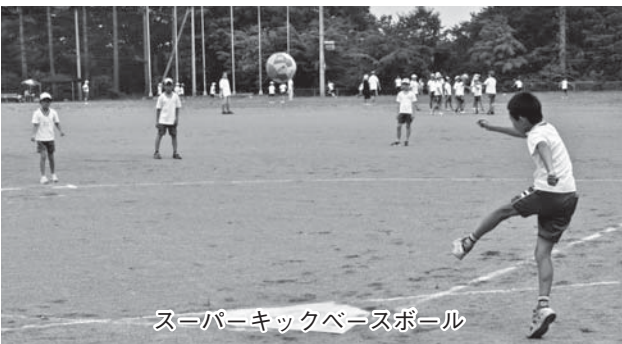
スーパーキックベースボール

7月23日にグリーンアリーナ神戸（兵庫県）で開催された本大会では、予選リーグで2試合とも健闘しましたが惜敗し、残念ながら決勝進出を逃しましたが、カブの部の最上級生となる来年の大会では、全国大会の上位入賞が期待されます。