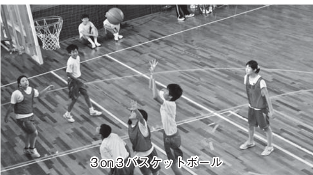
3on3バスケットボール