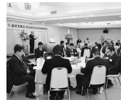
12月22日の受章祝賀会

さらに、栃木県農業者懇談会長、栃木県農業士、農協理事、町議会議員などの活動を通して、地域農業の振興・発展に貢献されました。これら永年の功績により受章されたものです。