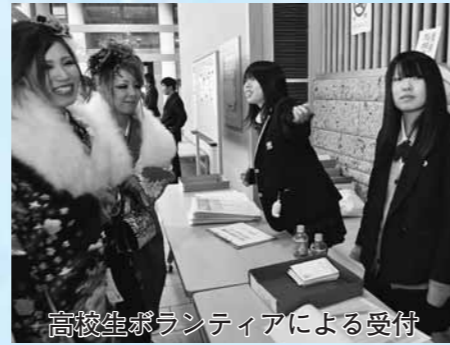
高校生ボランティアによる受付