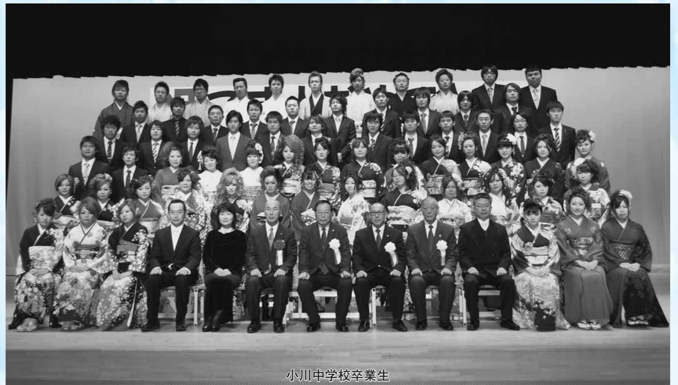
小川中学校卒業生