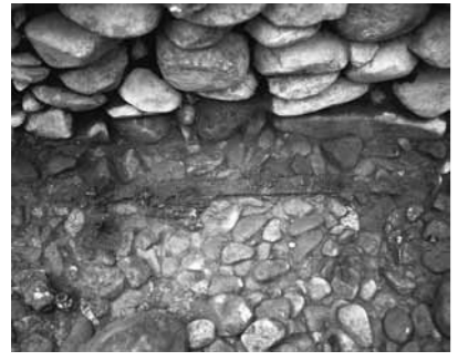
首長原古墳 遺物出土状況