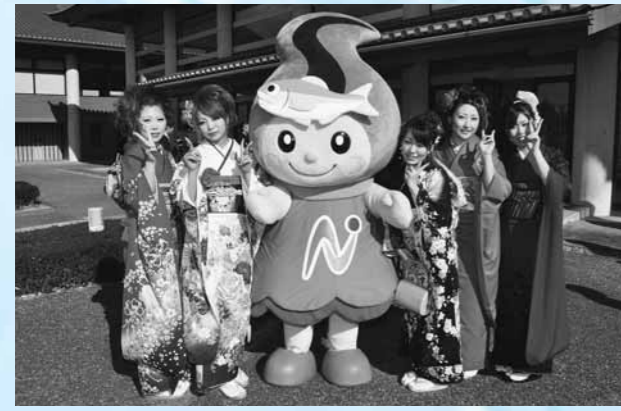
なかちゃんと一緒に記念写真