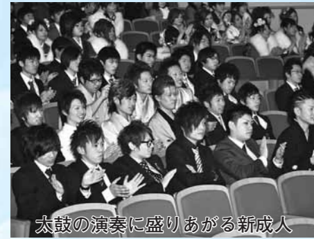
太鼓の演奏に盛りあがる新成人