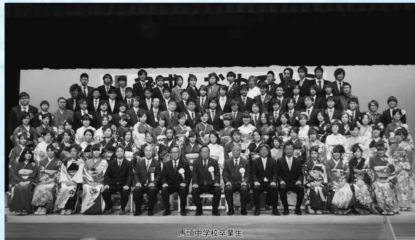
馬頭中学校卒業生