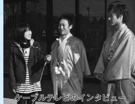
ケーブルテレビのインタビュー