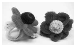
モールで作った指輪