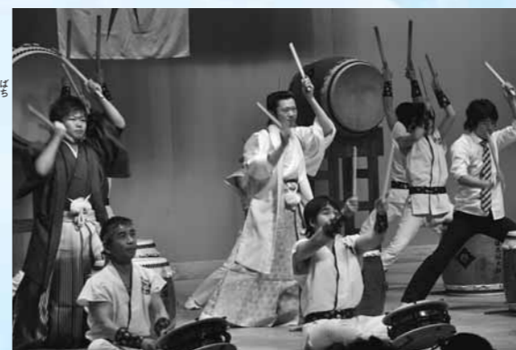
見事な佇まばきの新成人メンバー