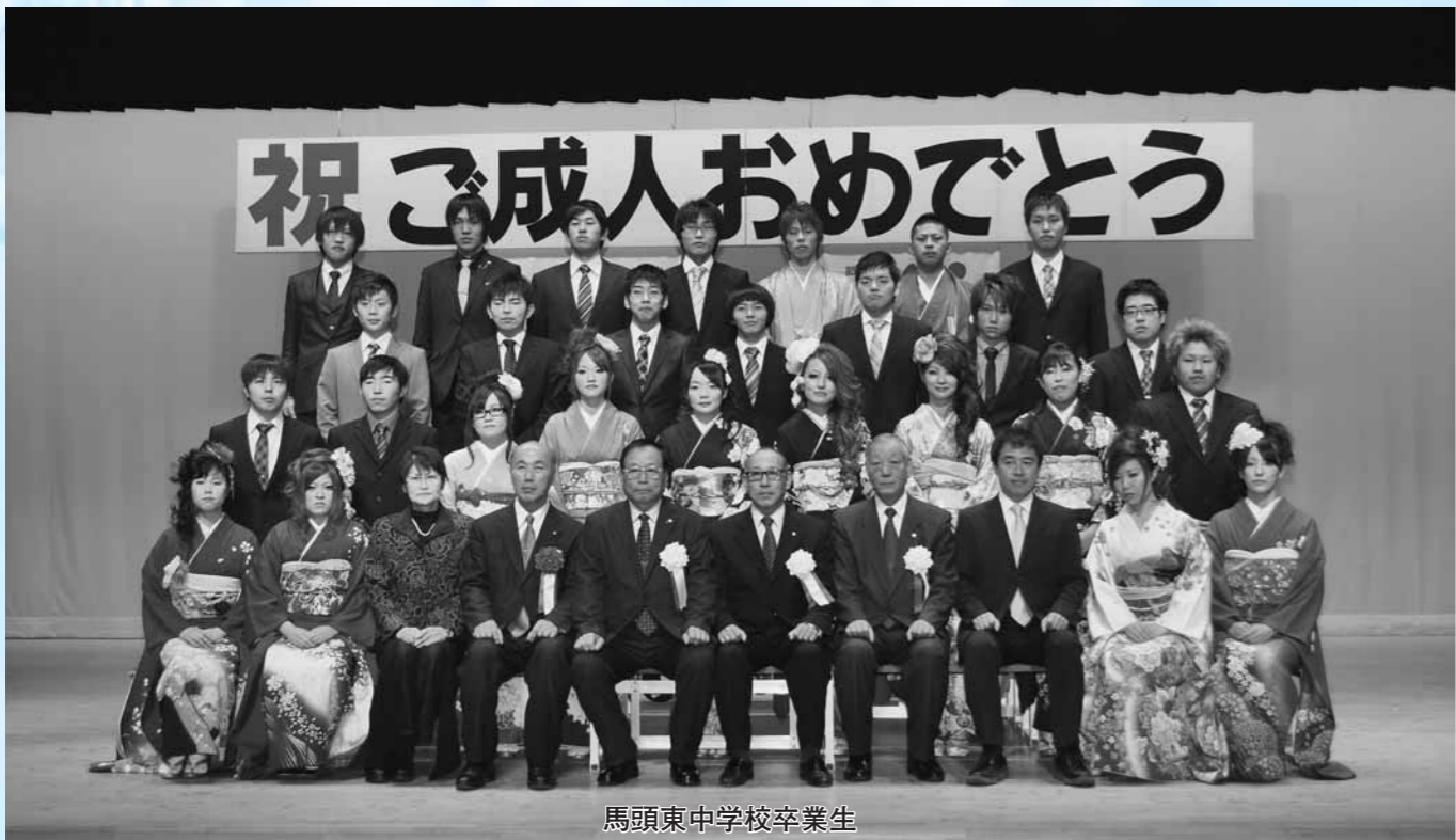
馬頭東中学校卒業生

現在、建築設備関係の仕事をしています。これからは、社会人としてしっかり社会に貢献していきたいです。子どものころは友人とよく山や川に行って遊んでいました。いつまでも自然あふれる環境を守って欲しいです。