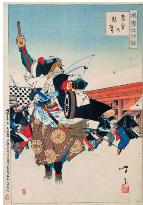
「撰雪六六談 奮勇の鼓聲」 二代目歌川芳宗

当然、浮世絵にも様々な役者が演じた『忠臣蔵』が描かれています。本展では江戸庶民に親しまれていた『忠臣蔵』の各場面を様々な絵師が各時代にどの場面をクローズアップして取り上げたか解るように展示しています。