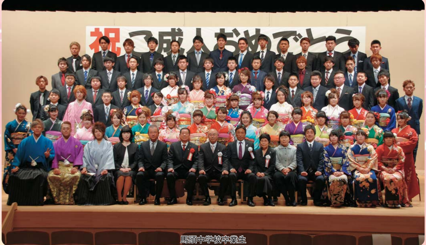
馬頭中学校卒業生