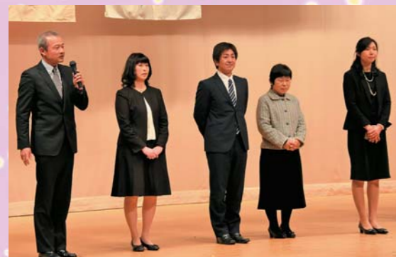
恩師からのメッセージ