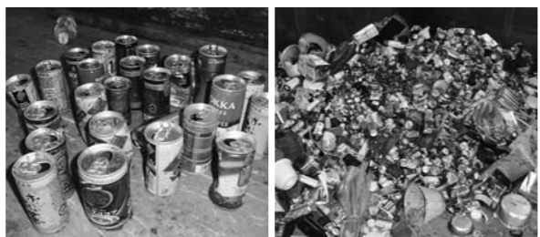
衛生センターに集められた燃えないごみ(写真右)と混入していた缶類を一部抜き出したもの(写真左)