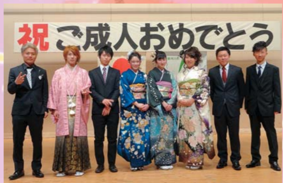
成人式実行委員のみなさん

式典終了後は、新成人8人で構成された成人式実行委員会企画による記念アトラクションとして、恩師からのビデオレター放映や、恩師(中学3年生時担任)からお祝いのことが贈られました。