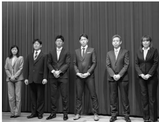
石井選手とご両親 星選手とご両親