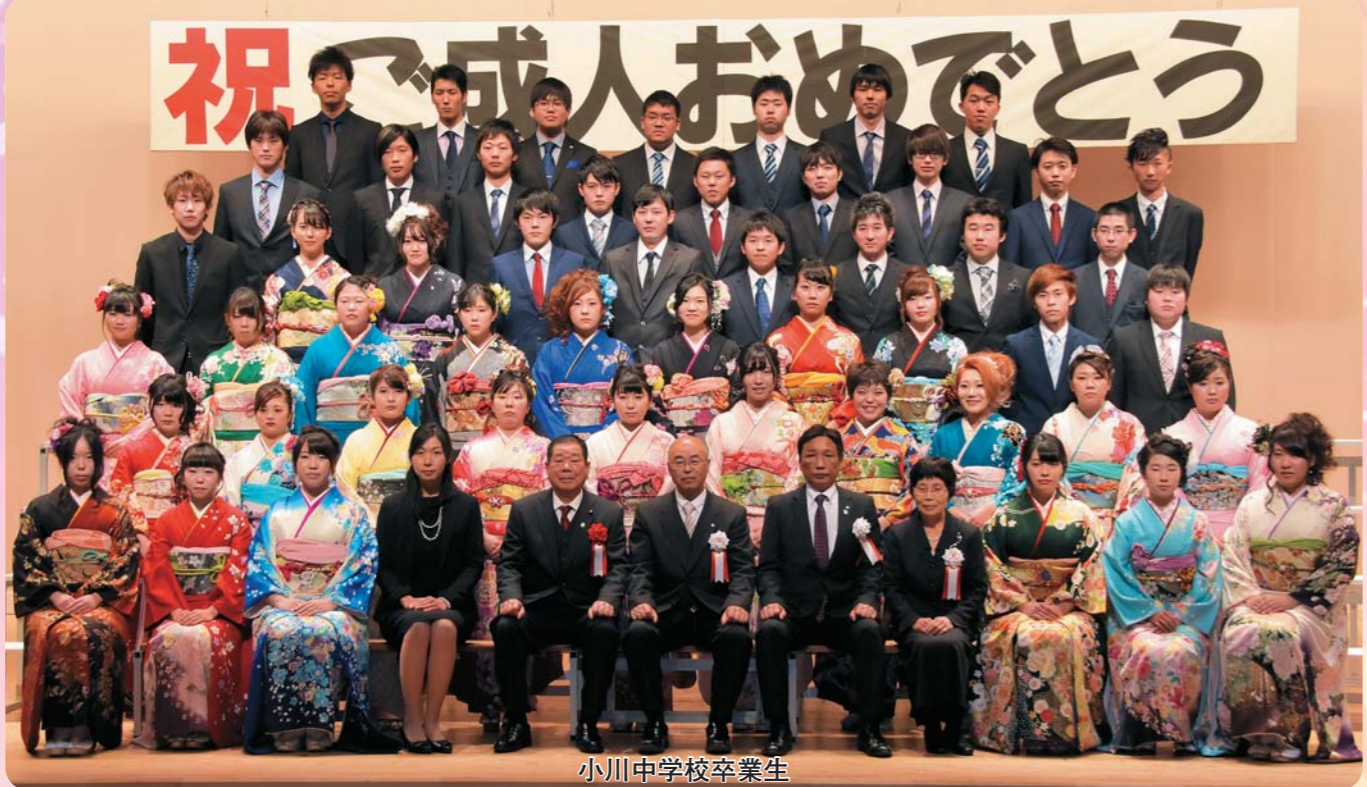
小川中学校卒業生

看護師の国家資格の合格を目指して、日々勉強に取り組んでいます。将来の夢は、早く看護師になって、親孝行をしたいと思っています。 これからも自然あふれる、きれいな町であってほしいです。