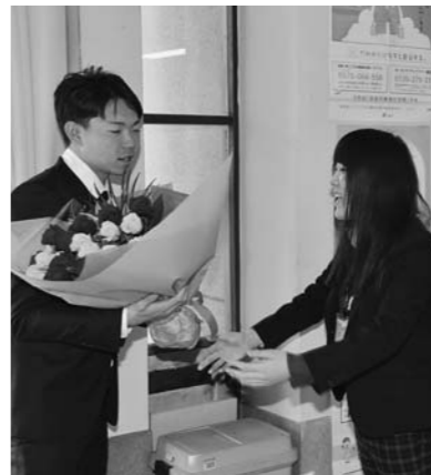
1月6日星選手表敬訪問