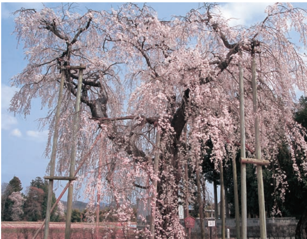
観音寺のしだれ桜(吉田)

八溝県立自然公園内に位置する本町は、緑豊かな山々と清らかな水に抱かれた美しい町です。親から子、子から孫へと受け継がれてきたこの豊かな自然の恵みに感謝し、これからも絶やすることなく、守り伝えていきたい。それが今を生きる私たちの使命でもあります。