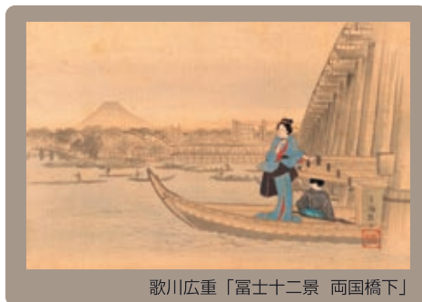
歌川広重「富士十二景 両国橋下」

The Nakagawa Town Bato Hiroshige Museum, opened with the aim of exhibiting works centered around the mid-nineteenth century ukiyo-e artist Utagawa Hiroshige, and encouraging local cultural activity, is the cultural pride of the town.