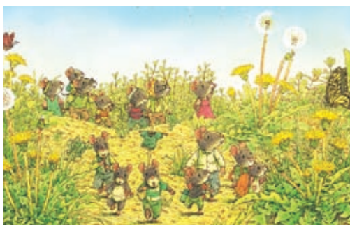
「14ひきのびくにつく」／童心社